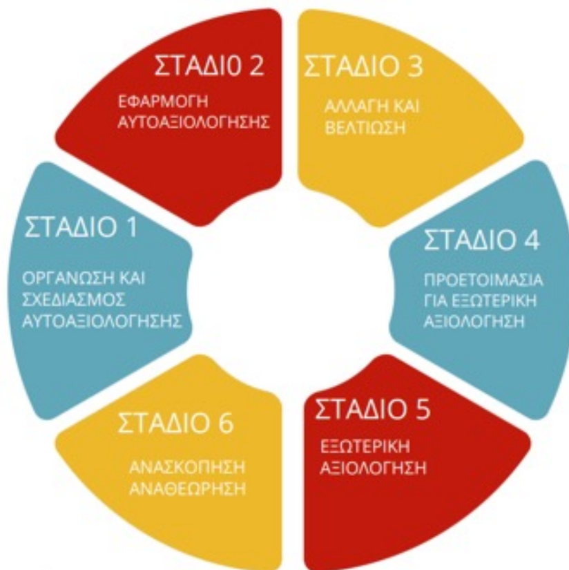
Ο κύκλος διασφάλισης ποιότητας των προγραμμάτων σπουδών Αρχικής Επαγγελματικής Κατάρτισης